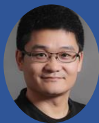
山世光教授 IEEE 会士 中国科学院